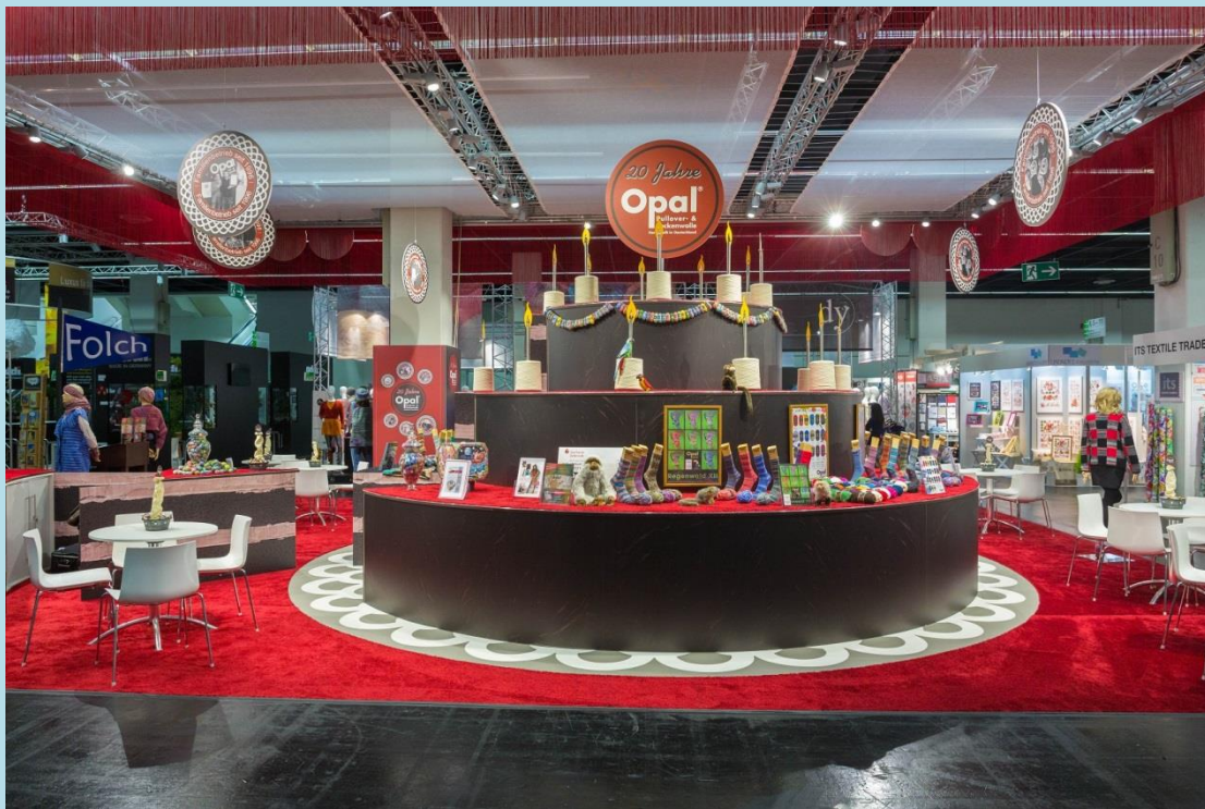
Geburtstagstorte als Präsentationsfläche