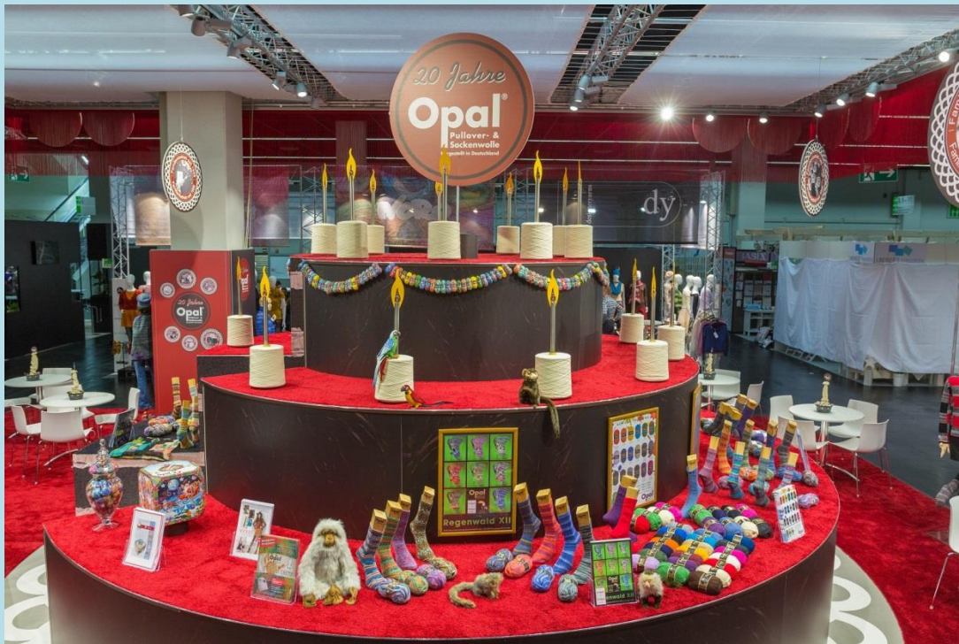
Kerzen, Korken, Luftschlangen