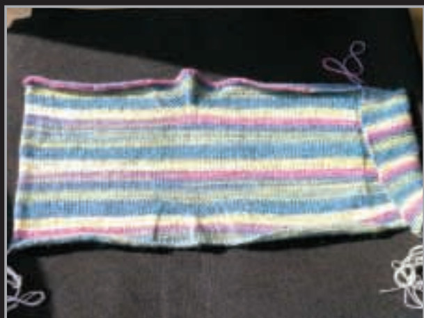
1. Offene Socke ohne Spitze

(Rück.-Reihe) die Maschen wie folgt stricken: 25 Maschen gerippt, 33 Maschen rechts, 26 Maschen Perlmuster, 32 Maschen links. Maschen auf der Nadel lassen, Faden nicht abschneiden, um damit später die Maschen für die Spitze aufzunehmen. Mit dem Endfaden vom Maschenanschlag die hintere Naht im Maschenstich zusammennähen (Bild 2). Für die Spitze mit dem Nadelspiel aus dem unteren Rand der Socke 52 Maschen gleichmäßig verteilt neu aufnehmen. 1 Reihen links stricken, weiter wie folgt: 12 Maschen Perlmuster (beginnend mit der 1. Masche nach der Naht), 3 Maschen überzogen zusammenstricken (2 Maschen zusammen wie zum Rechtsstricken abheben. 1 Masche rechts stricken, dann die beiden abgehobenen Maschen darüber ziehen), 23 Maschen Perlmuster, 3 Maschen überzogen zusammenstricken, 11 M. Perlmuster. Diese Abnahme noch 6 mal in jeder 2. Runde und 4 mal in jeder Runde wiederholen. Es sind noch 8 Maschen übrig. Diese Maschen mit dem Arbeitsfaden zusammenziehen. Faden auf der Innenseite vernähen (Bild 3).