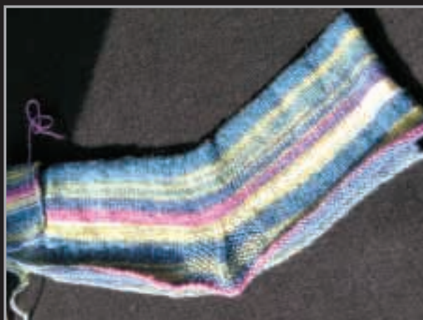
2. Offene Socke zusammengelegt, fertig um hintere Naht im Maschenstich zusammen zu nähen.