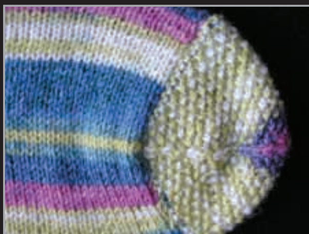
3. Spitze fertig